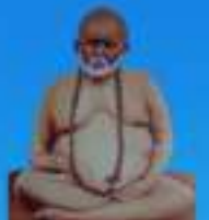
గురు శ్రీశ్రీ స్వామి