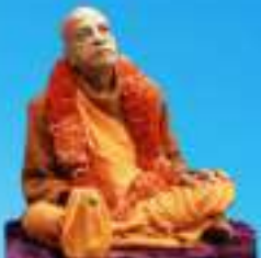
గురు భక్తవినాయక ప్రభుత్వ