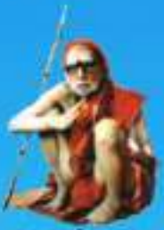
గురు పంచశతక పరమహంసానంద్