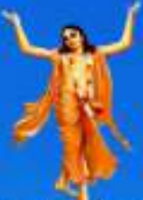
గురు చైతన్య మహా ప్రభుత్వ