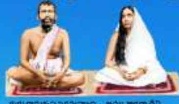
గురు రామకృష్ణ పరమహంసాచారి శిష్య శారదా దేవి