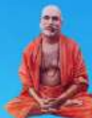
గురు రుక్మావతి శిష్యుడు