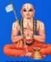
గురు రామానుజ మహర్షి