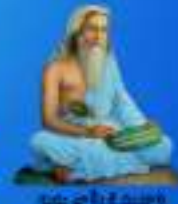
గురు వాగ్మీకీ మహర్షి