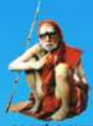
గురు పంచశతక పరమహంసాచారి