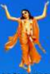
గురు చైతన్య మహా ప్రభుత్వ