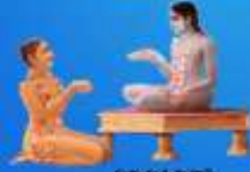
గురు శివ మహర్షి