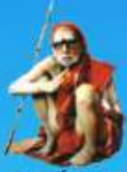
గురు పంచశతక పరమహంసానంద్