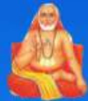
గురు శాంతిశివ మహర్షి