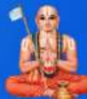
గురు రామానుజ మహర్షి