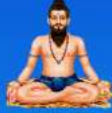
గురు సీతామతీ మహర్షి