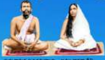
గురు రామకృష్ణ పరమహంసానంద్ శాంతి శారదా రేడి