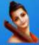
గురు వాణిజ మహర్షి