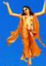
గురు చైతన్య మహా ప్రభుత్వం