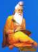
గురు పరీయార్థి మహర్షి