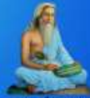
గురు వాగ్మీకీ మహర్షి