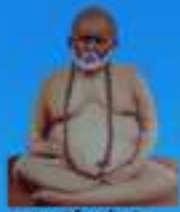
గురు శ్రీనివాస మహర్షి