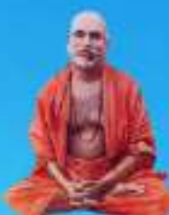
గురు శ్రీ శ్రీ శ్రీ