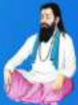
గురు శ్రీ శ్రీ శ్రీ