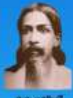
గురు శ్రీ శ్రీ శ్రీ