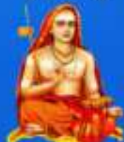
గురు శ్రీ శ్రీ శ్రీ