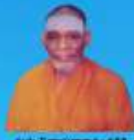
గురు శ్రీ శ్రీ శ్రీ