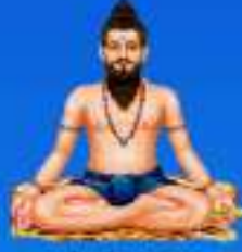
గురు శ్రీ శ్రీ శ్రీ