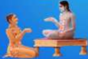
గురు శ్రీ శ్రీ శ్రీ