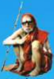
గురు శ్రీ శ్రీ శ్రీ