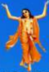
గురు శ్రీ శ్రీ శ్రీ