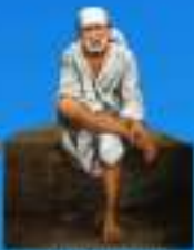
గురు శ్రీ శ్రీ శ్రీ