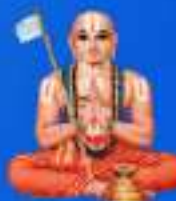
గురు శ్రీ శ్రీ శ్రీ