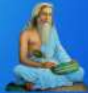
గురు శ్రీ శ్రీ శ్రీ