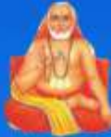
గురు శ్రీ శ్రీ శ్రీ