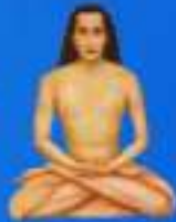
గురు శ్రీ శ్రీ శ్రీ