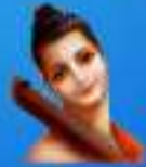
గురు శ్రీ శ్రీ శ్రీ