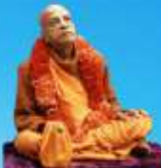
గురు శ్రీ శ్రీ శ్రీ