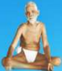
గురు శ్రీ శ్రీ శ్రీ