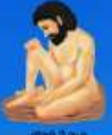
గురు శ్రీ శ్రీ శ్రీ