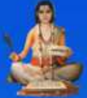
గురు శ్రీ శ్రీ శ్రీ