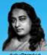
గురు శ్రీ శ్రీ శ్రీ