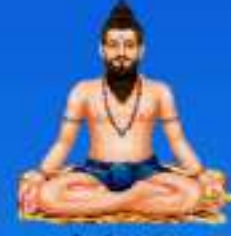
గురు వీరస్వామి స్వామి