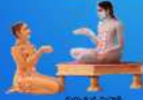
గురు శివ మూర్తి