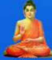
గురు గోపాల మూర్తి