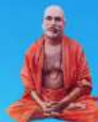
గురు రుణాచార్య స్వామి