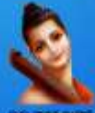
గురు వాణిజ మూర్తి