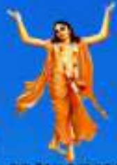
గురు చైతన్య మహా ప్రభులు