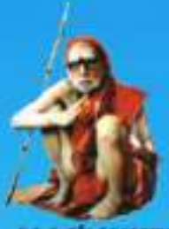
గురు పండ్రిశేఖర పరమహంసానాం