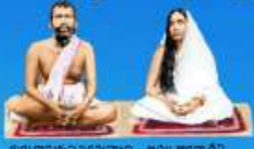
గురు రామకృష్ణ పరమహంసానాం శిష్య శారదా దేవి