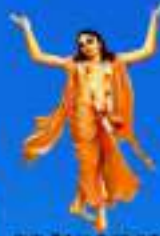
గురు చైతన్య మహా ప్రభులు