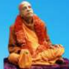
గురు భక్తవేదాంత ప్రభుపాద