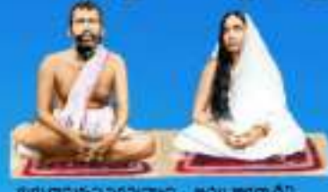
గురు రామకృష్ణ వరమహారాజ్ అమ్మ శారదా దేవి