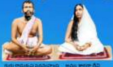
గురు రామకృష్ణ పరమహంస శిష్య శారదా దేవి