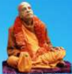
గురు భక్తివేదాంత ప్రభుపాద