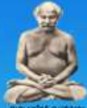
గురు భారత మహాత్మ్య