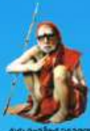
గురు పంచశతక పరమహంస