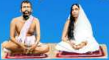
గురు రామకృష్ణ పరమహంస శిష్య శారదా దేవి